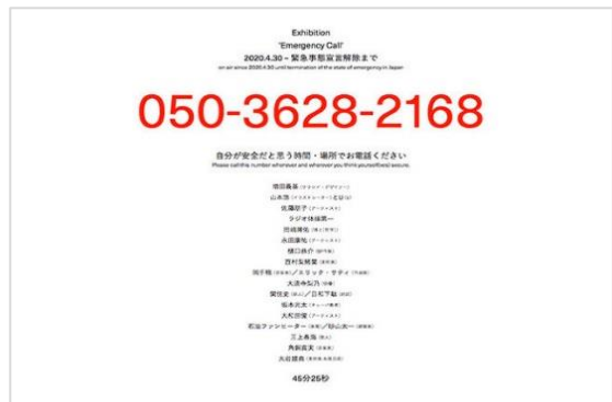
《Emergency Call》2020 ウェブページより