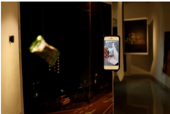
《こないだの話》2018 / インスタレーション / 写真、映像 (3min x 18)、iPhone、ビニール袋、封筒、他