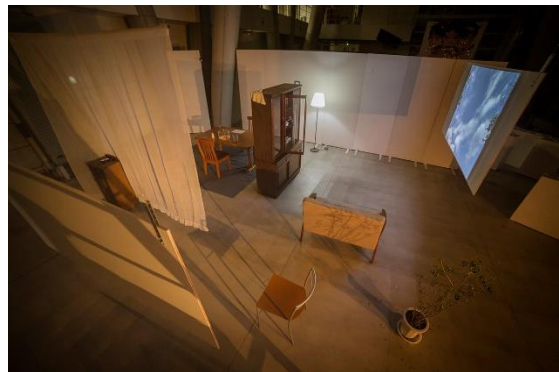
《違う月を見ている》2020 / インスタレーション / 家具、雑貨、iPhone、通話音声、映像、他 model : Mishima Erika